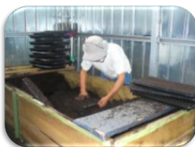
Figura 1 Título breve y descriptivo en cursiva

Nota. Operario llenando semilleros o bandejas con turba. SENA (2018).